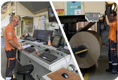
Operatori equipaggiati con il VOKKERO GUARDIAN in una fabbrica di cartone

A 30 metri di altezza e con le mani dedicate al governo della macchina, il gruista deve rimanere in contatto con gli operatori a terra per garantire la guida e la precisione della manovra ed evitare incidenti in cantiere. Il pedale push-to-talk VOKKERO in cabina, abbinato a un altoparlante Bluetooth, garantisce uno scambio di informazioni costante e istantaneo. L'operatore a terra può condividere le informazioni con quello della gru tramite le sue cuffie Bluetooth.