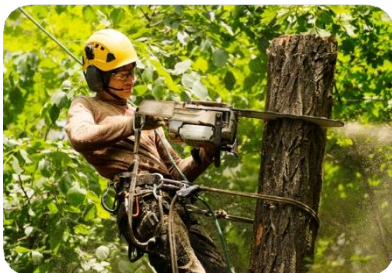
Potatore con cuffie di protezione dell'udito

Il sistema wireless offre una libertà di movimento e un comfort di lavoro senza pari. Inoltre, la tecnologia VOKKERO offre la possibilità di creare gruppi di lavoro per strutturare gli scambi tra le varie postazioni della catena industriale.