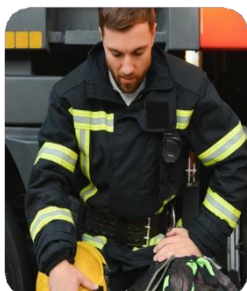
Vigile del fuoco con altoparlante a spalla

In un ambiente di lavoro rumoroso e ad alto rischio come quello della potatura, è essenziale poter comunicare con i compagni di squadra, proteggendo al contempo le orecchie dal rumore. Le cuffie di protezione dell'udito con isolamento acustico Bluetooth garantiscono una comunicazione costante e offrono una libertà di movimento senza pari, senza il rischio che i cavi vengano strappati o tagliati.