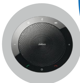
Altoparlante combinato con pedale push-to-talk