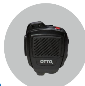
Microfono con altoparlante a spalla