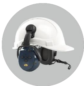
Casco di protezione dell'udito